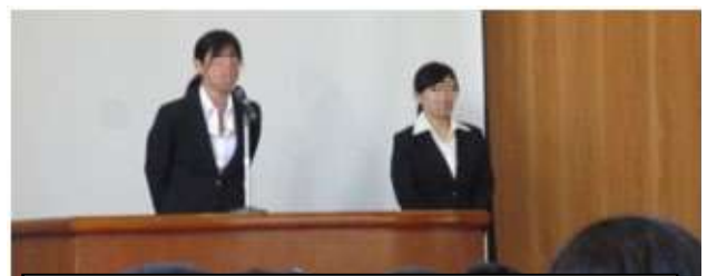
体育館でのあいさつも感動的でした。

6月3日から3週間の実習を行いました。積極的に生徒にとけこんで、熱心に指導する姿は、生徒たちにも好影響でした。