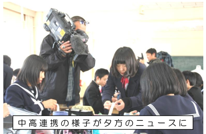
中高連携の様子がタワのニュースに