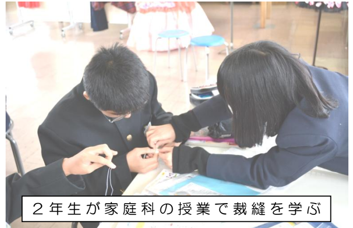
2年生が家庭科の授業で裁縫を学ぶ