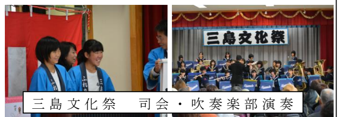
三島文化祭 司会・吹奏楽部演奏