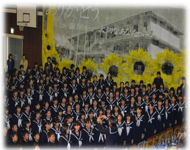
全校合唱『心の中できらめいて』

PTA、おやじの会の皆様には、前日から昼食バザーの準備をしていただき誠にありがとうございました。バザーで食べた味は、生徒にとって忘れられない味になると思います。教職員共々深く感謝申し上げます。